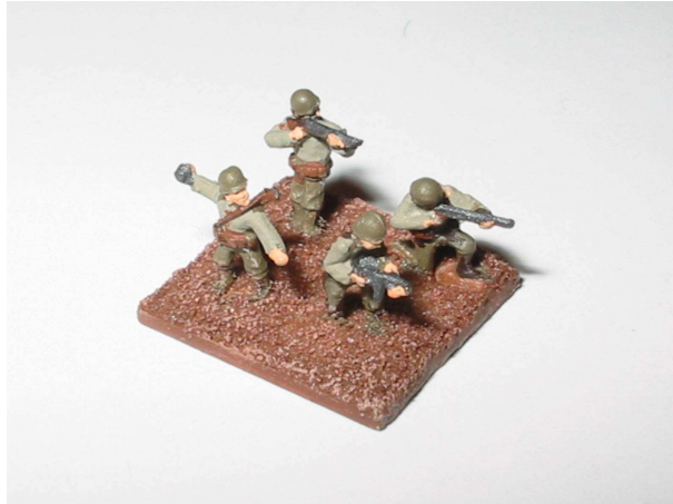
Podstawka Karabinów (ale równie dobrze karabinków lub PM)

Prezentacja na podstawie: 3-4 modele na podstawie.